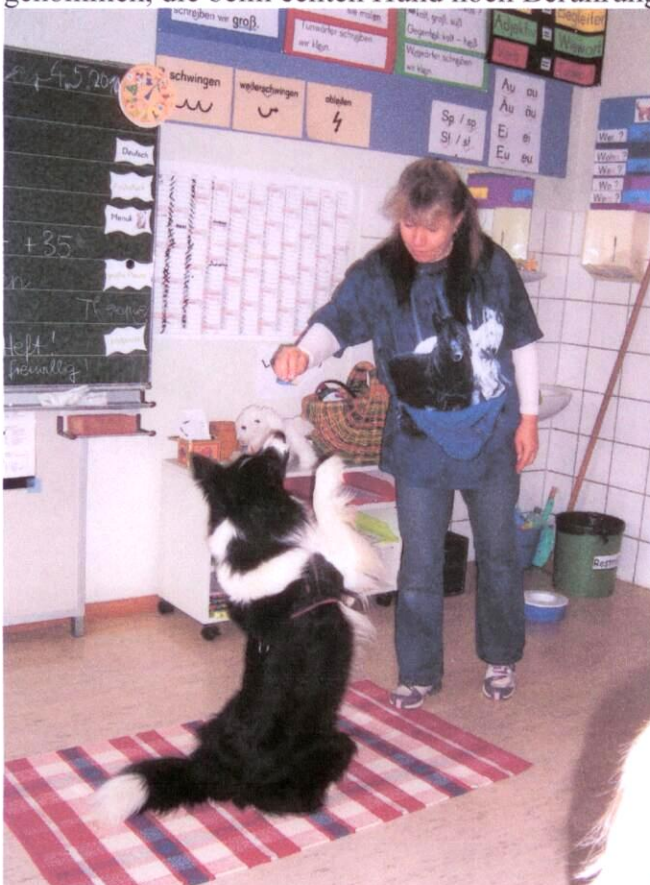
Sky bei der Trick-Arbeit in der Gebrüder

(Stoff)Hund zu Demonstrations-Zwecken. Wird gern auch als Vermittler für Kinder genommen, die beim echten Hund noch Berührungs-Ängste haben.