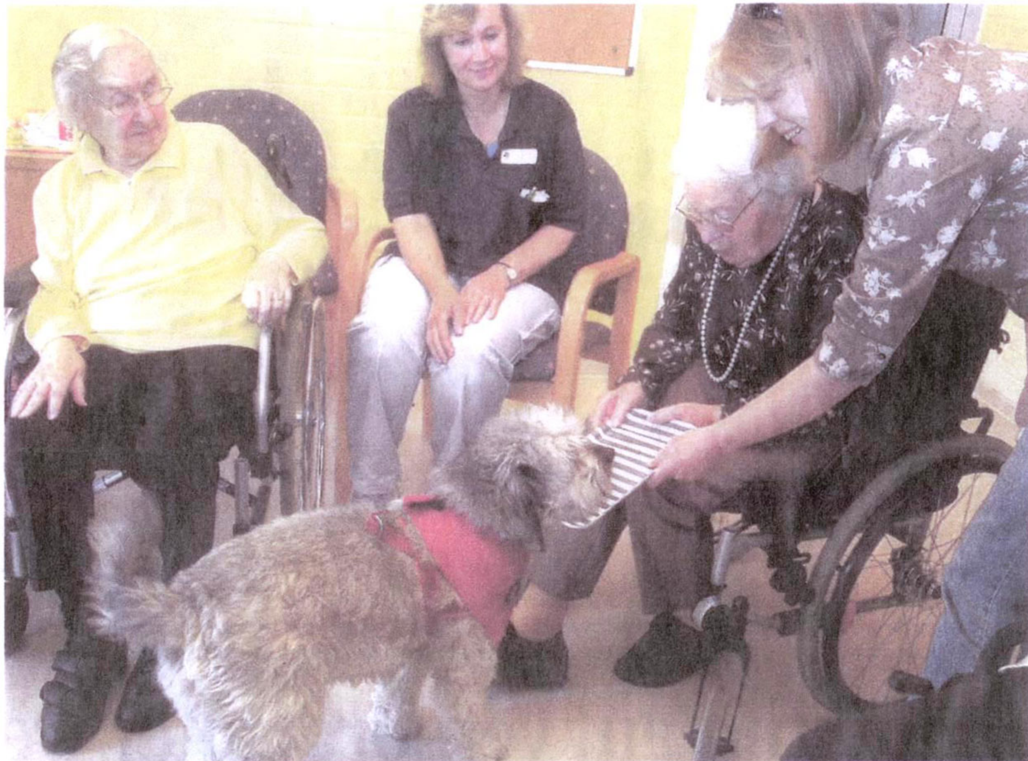
Da geht einem das Herz auf: Vorsichtig fischt sich Mischlingshund Struppi das Leckerli vom Tablett. In Pflegeheime gehen die Hundebesitzerinnen mit ihren umgänglichen Tieren besonders gerne.

Ausbildung In hundert Stunden Ausbildung haben die Frauen viel über ihre Hunde und den Umgang mit ihnen gelernt. Ihre Vierbeiner studierten kleine Tricks wie Teppich aufrollen, Jacken ausziehen oder Schubladen aufziehen ein. „Für solche Einsätze wie hier im Altenheim wissen sie außerdem, wie sie sich einem Rollstuhl nähern und die Vorderpfoten auf den Schoß des Bewohners legen, um sich streicheln zu lassen“, ergänzt Hartan. Theoretisch könnten die drei Fellträger